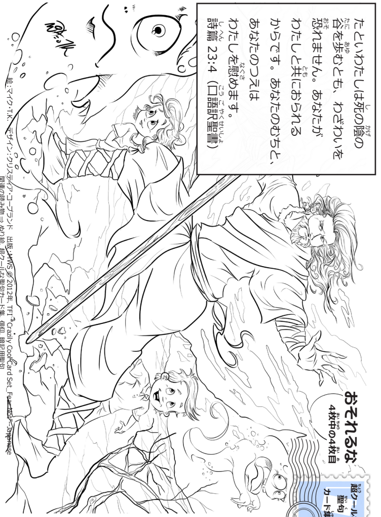
絵:マイク・T.K. デザイン:クリスティア・コブランド 出版:MWS © 2012年、TFI "Crazily Cool Card Set_Fear Not"-Japanese 関連の読み物 → あり絵、超クールな聖句カード集、信仰、暗記用聖句

たといわたしは死の陰の 谷を歩むとも、わざわざいを おそれません。あなたが わたしと共におられる からです。あなたのおちと、 あなたのおつえは わたしを慰めます。 詩篇 23:4 (口語訳聖書)