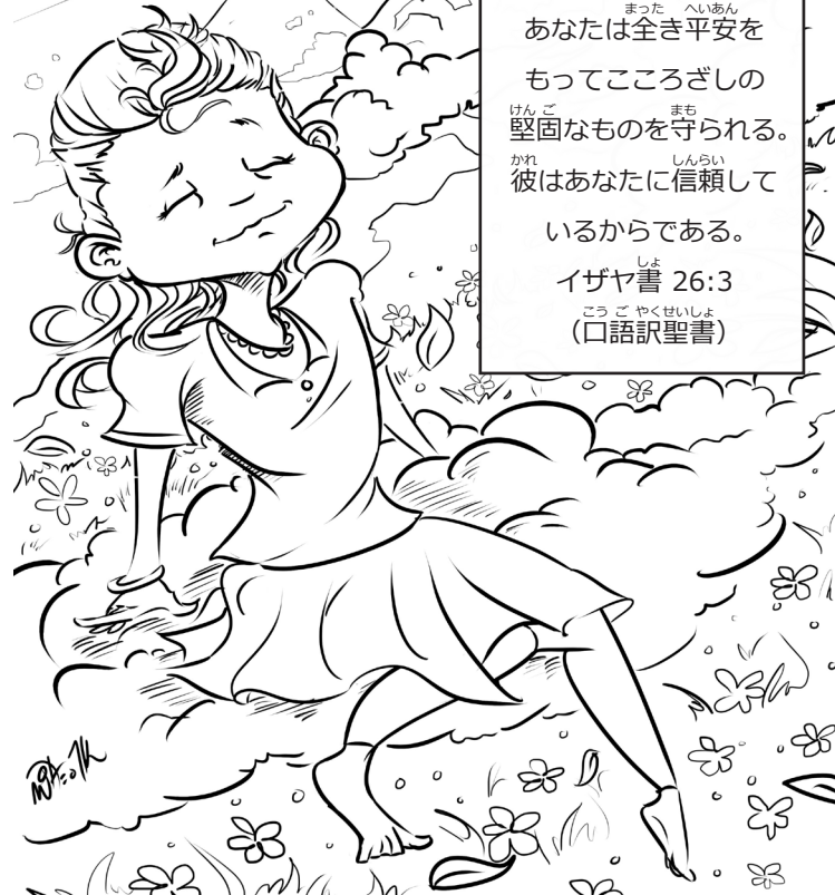
絵:マイク・T.K. デザイン:クリスティア・コブランド 出版:MWS © 2012年、TFI "Crazily Cool Card Set_Fear Not"-Japanese 関連の読み物 → あり絵、超クールな聖句カード集、信仰、暗記用聖句

あなたは全き平安を もってこころざしの 堅固なものを守られる。 彼はあなたに信頼して いるからである。 イザヤ書 26:3 (口語訳聖書)