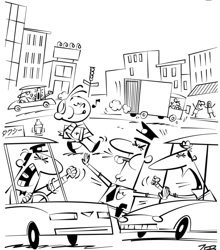
絵:ゼブ デザイン:クリスティア・コブランド 出版:MWS © 2012年、TFI "Crazily Cool Card Set_Fear Not"-Japanese 関連の読み物 → あり絵、超クールな聖句カード集、信仰、暗記用聖句

ひとをおそれると、わなに陥る、 主に信頼する者は安らかである。 箴言 29:25 (口語訳聖書)