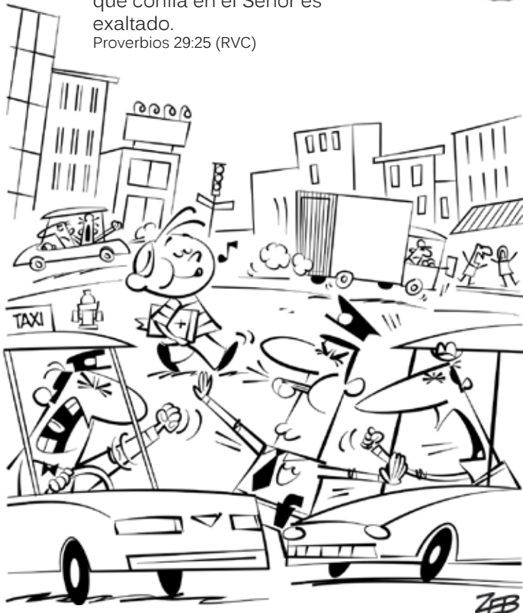
Publicado por Rincón de las maravillas. © La Familia Internacional, 2013

El miedo a los hombres es una trampa, pero el que confía en el Señor es exaltado. Proverbios 29:25 (RVC)