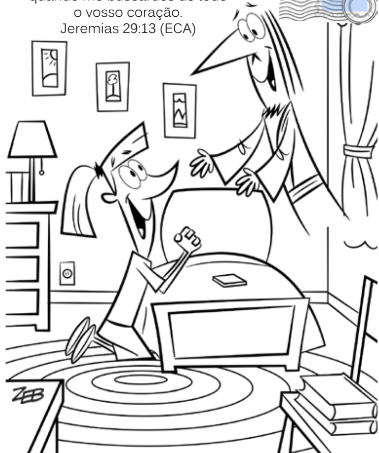
Publicado por My Wonder Studio. Copyright © 2012 A Família Internacional

Buscar-me-eis, e me achareis, quando me buscardes de todo o vosso coração. Jeremias 29:13 (ECA)