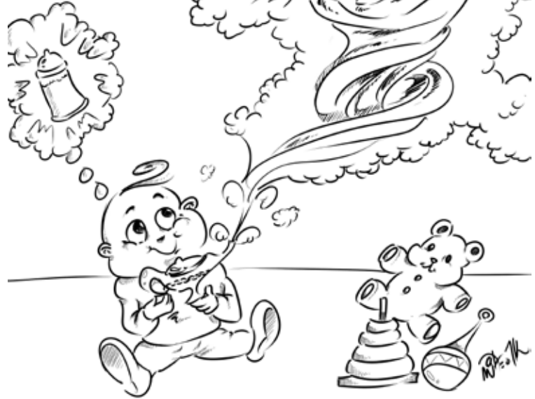
Publicado por My Wonder Studio. Copyright © 2012 A Família Internacional

Se permaneceres em mim, e as minhas palavras permanecerem em vós, pedireis o que quiserdes, e vos será feito. (ECA)