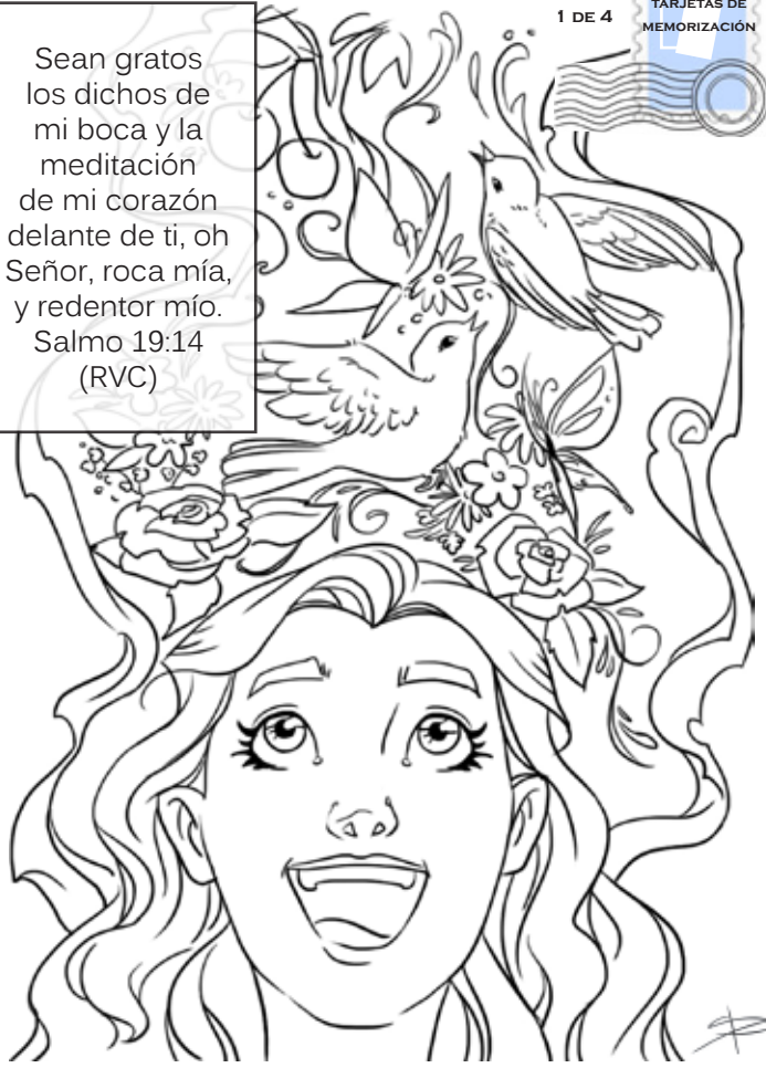
Publicado por Rincón de las maravillas. © La Familia Internacional, 2012

Sean gratos los dichos de mi boca y la meditación de mi corazón delante de ti, oh Señor, roca mía, y redentor mío. Salmo 19:14 (RVC)