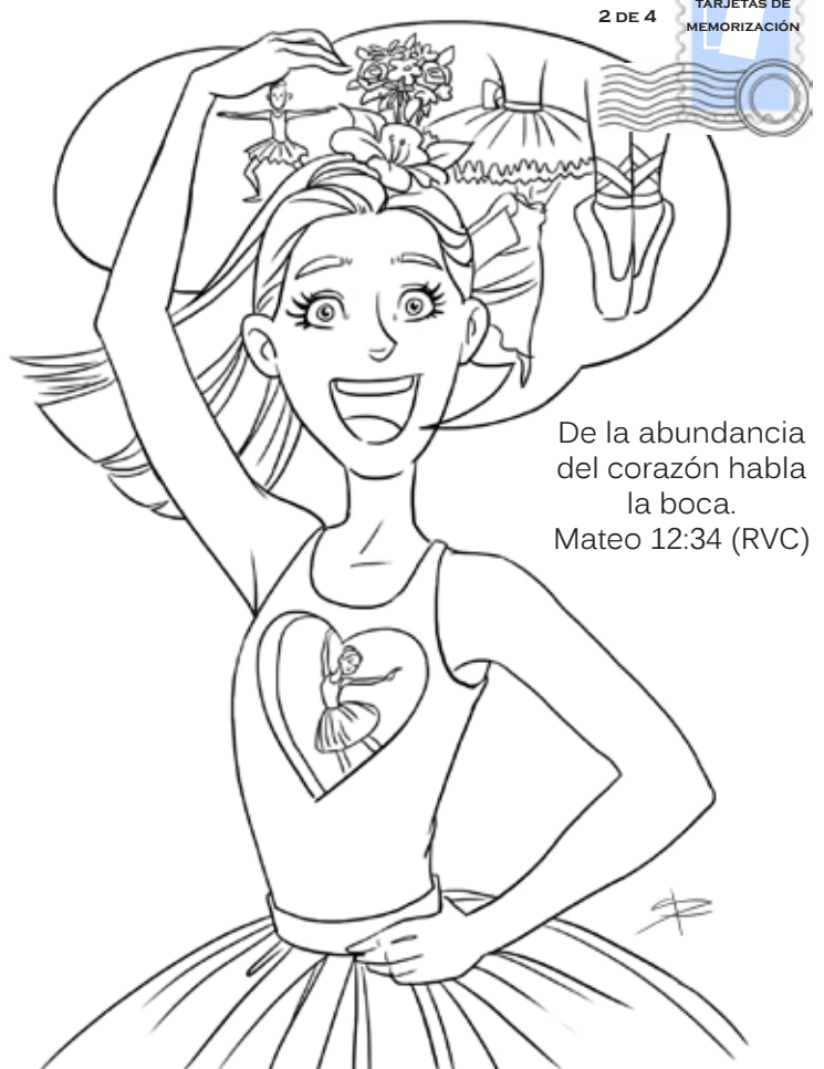
Publicado por Rincón de las maravillas. © La Familia Internacional, 2012

De la abundancia del corazón habla la boca. Mateo 12:34 (RVC)