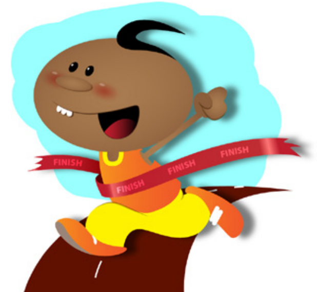
ganar una carrera