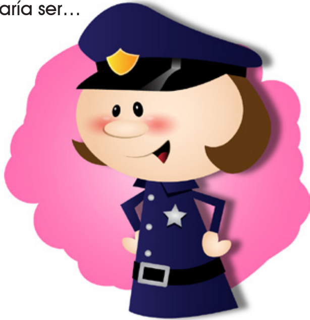
oficial de policía