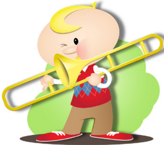
tocar un instrumento musical

¿Qué cosa te gustaría muchísimo poder hacer alguna vez?