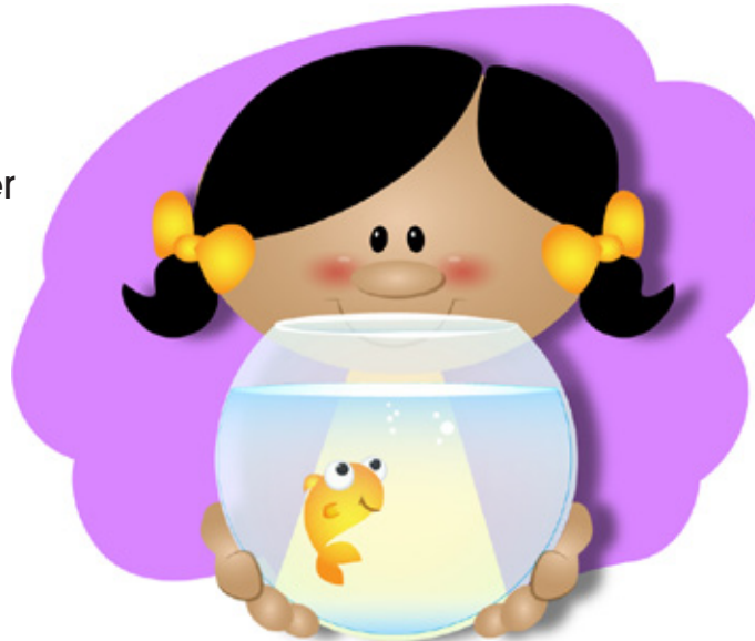
tener una mascota que cuidar