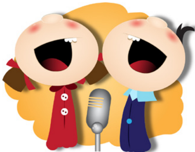
cantar para alegrar a otras personas