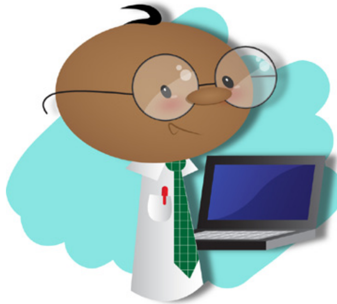
programador de computación